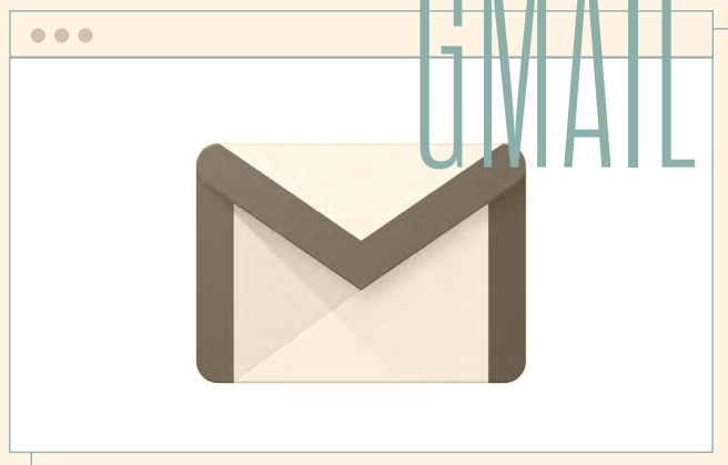
Pronti al calendario nelle mail?

Due dei servizi più usati al mondo hanno annunciato da poco il loro redesign. Come si ridisegna l'esperienza di un colosso del web? Quali sono le considerazioni da fare quando la tua utenza è di svariati milioni di user ed è "legata" a certi utilizzi?